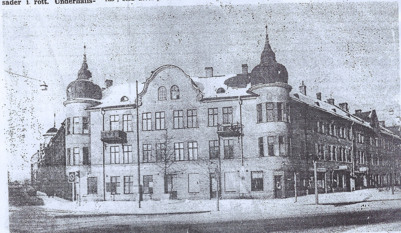
● DÅ; hörnhuset Änggatan—Kungsgatan i början på 80-talet då rivning var beslutad och ingen räddning fanns för den ståtliga gamla fastigheten. Trots kulturnämndens försök att få den bevarad.