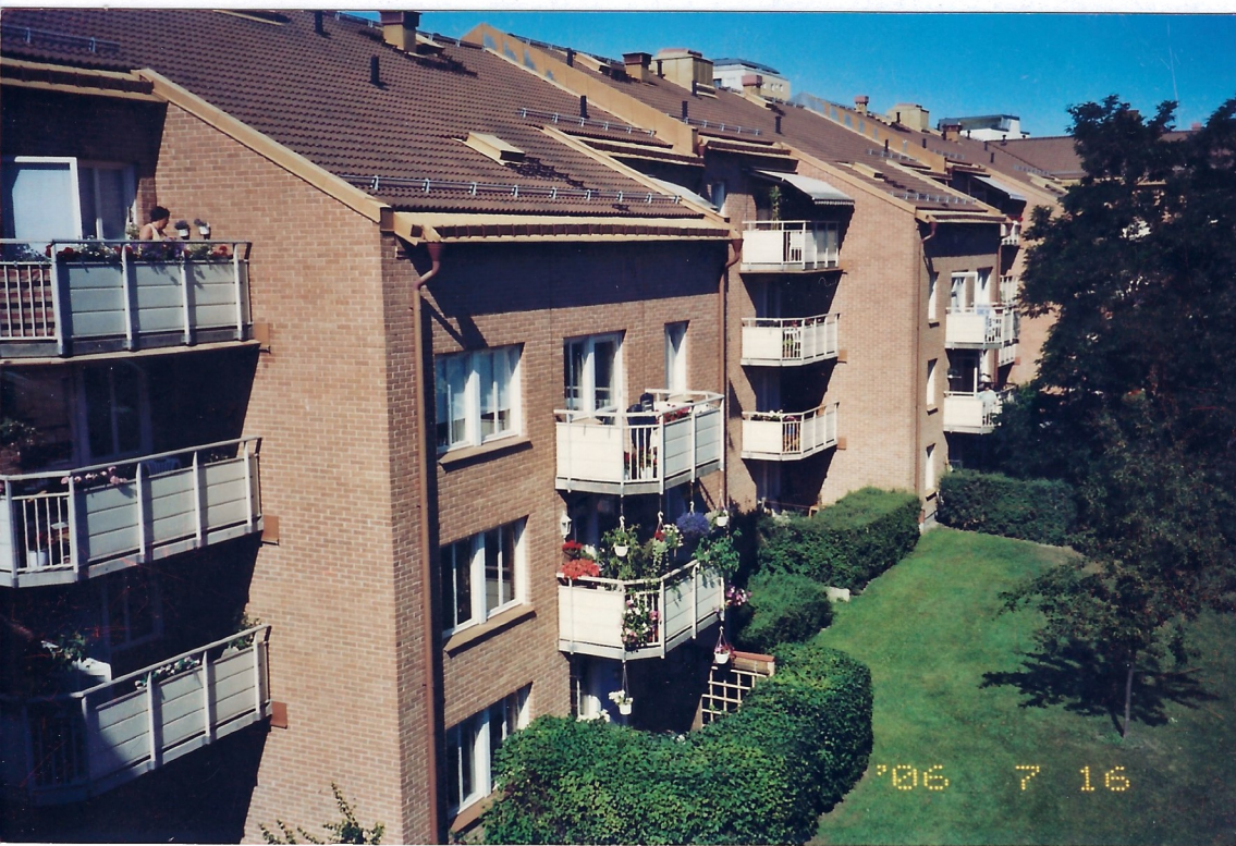
Här har medlemmarna ordnat med en kräftskiva.